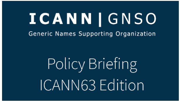
ICANN63 öncesi GNSO Bilgilendirmesi