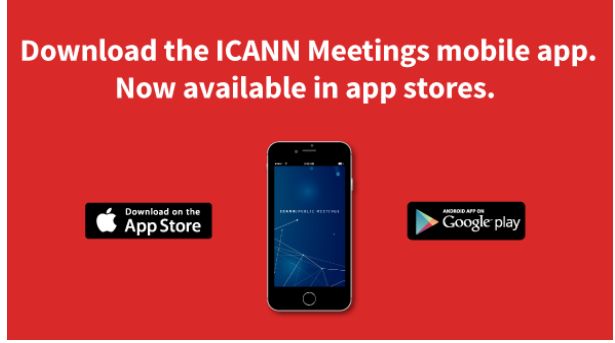
ICANN Toplantıları Mobil Uygulaması