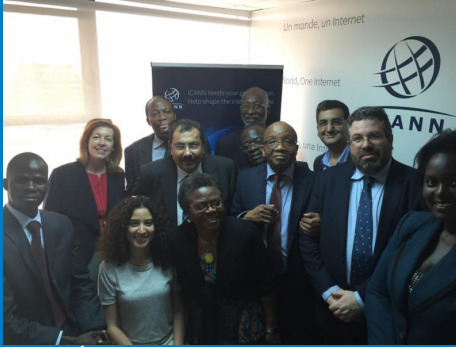
Yeni Afrika İlişkileri Ofisimizde ICANN Personeli ve Topluluğu