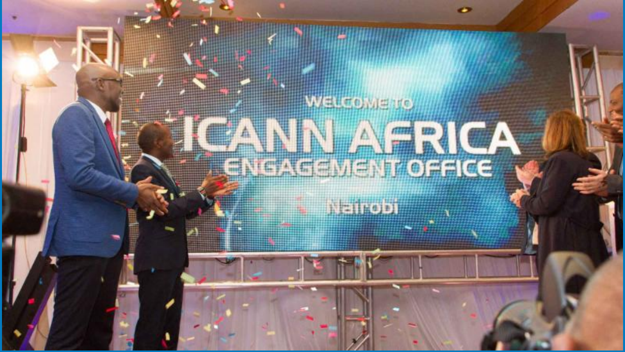
ICANN Açılış Yemeği