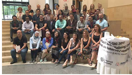
Bu yıl MEAC-SIG'de 13 ülkeden tam 31 katılımcı yer aldı.

Bu çalışmadan doğan öneriler SEEDIG topluluğunun onayına tabi tutulacak. Onaydan sonraki adım ise bu Eylül ayında yeni yürütme komitesi için seçim sürecini başlatmak olacak. Bu inisiyatife ilişkin güncellemeler için bu alanı izleyin: http://www.seedig.net/ .