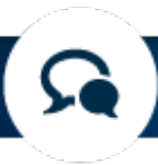
График конференции ICANN60 включает подробные описания заседаний и инструкции по подключению для удаленных участников. Надеемся на встречу в Абу-Даби!