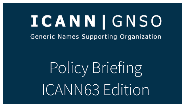
Отчет GNSO к конференции ICANN63