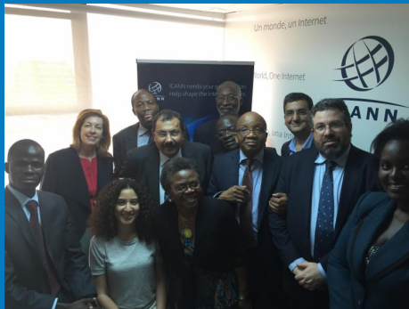
Персонал и сообщество ICANN в нашем новом центре сотрудничества в Африке