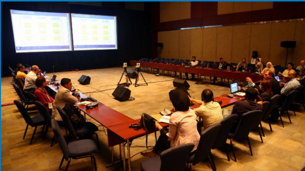
Участники обсуждают в Хайдерабаде, в Индии, стратегию деятельности ICANN на Ближнем Востоке.