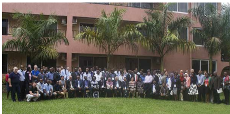
Участники конференции UbuntuNet-Connect 2016 в городе Энтеббе (Уганда).