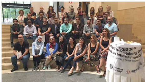
В этом году собрание MEAG-SIG посетил 31 участник из 13 стран.

По итогам этой работы будут составлены рекомендации, подлежащие утверждению сообществом SEEDIG. Следующим этапом после их утверждения, в сентябре этого года, станет запуск процесса выборов нового состава исполнительного комитета. Актуальные новости об этой инициативе можно узнать здесь: http://www.seedig.net/ .