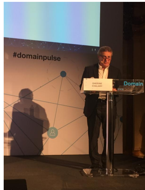
Шерин Шалаби (Cherine Chalaby) обращается к участникам мероприятия «Пульс домена 2017».

Одной из тем дискуссии стало то, каким образом будет выглядеть ICANN после передачи координирующей роли в исполнении функций IANA, а конкретно - будет ли новая система достаточно стабильна. На других заседаниях обсуждались такие темы как текущее состояние рынка доменных имен, невмешательство в личную жизнь и защита данных, а также сложности, с которыми сталкивается доменная отрасль.