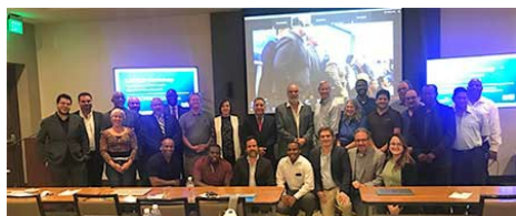
Participantes do Fórum LAC DNS em San Juan, Porto Rico.