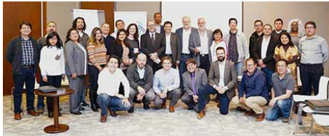
Participantes do workshop GFCE em La Paz, Bolívia.