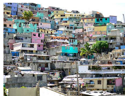
Porto Príncipe, Haiti

Leia a nossa postagem recente no blog para ver uma compilação das atividades da equipe da LAC da ICANN para promover o DNS (Domain Name System, Sistema de Nomes de Domínio) na região do Caribe no último ano. Você verá um resumo dos destaques no ano.