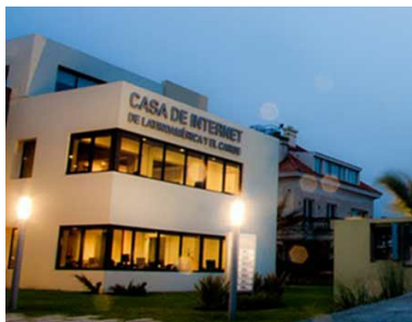
Casa de Internet, Montevideo, Uruguai