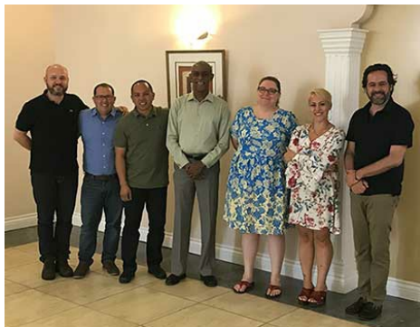
Equipe da ICANN para América Latina e Caribe se reúne em Santa Lúcia para o encontro regional geral