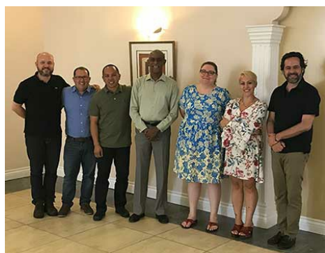
Equipe da ICANN para América Latina e Caribe se reúne em Santa Lúcia para o encontro regional geral