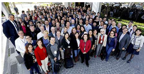
TICAL 2016 s'est tenue à Buenos Aires, Argentine, du 13 au 15 septembre 2016.

Le groupe d'opérateurs de réseau d'Amérique latine et des Caraïbes (LACNOG) est une communauté qui gère les réseaux Internet de la région et partage ses expériences à travers la liste de diffusion lacnog@lacnog.org . Une fois par an, notre principale réunion vise à renforcer les liens entre les opérateurs et à partager les dernières actualités sur le fonctionnement des réseaux et la technologie. Depuis septembre, LACNOG co-organise des réunions avec d'autres communautés de la région. Notre première expérience fut celle de travailler avec RedClara, l'organisateur de TICAL 2016 , une conférence adressée aux directeurs des technologies de l'information et des