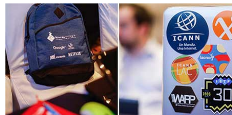
L'ICANN est un sponsor de longue date des événements de LACNIC.

La réunion annuelle du Registre des adresses Internet d'Amérique latine et des Caraïbes (LACNIC) a eu lieu à San José, Costa Rica, du 26 au 30 septembre. Comme d'habitude, la réunion s'est tenue en marge de la Conférence annuelle de LACNOG. Le programme général comportait une journée d'ateliers de formation consacrés aux nouvelles technologies, à la sécurité et au déploiement du protocole Internet version 6 (IPv6) ; et quatre jours de conférences et de tables rondes sur des sujets d'actualité, avec des présentations faites par des experts de renommée mondiale.