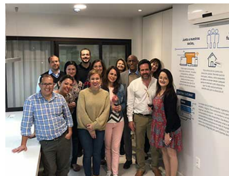
Participants à la réunion plénière du bureau régional de Montevideo et de la Casa de Internet de la région Amérique latine et Caraïbes.

Du 4 au 6 décembre 2018, le bureau régional de Montevideo a tenu sa première réunion générale avec tout le personnel de l'ICANN basé dans la région Amérique latine et Caraïbes (LAC) et le personnel chargé du soutien au niveau mondial, afin d'établir de nouvelles priorités. Le groupe avait prévu un programme complet d'activités parmi lesquelles un atelier sur les meilleures pratiques et l'innovation, des points d'étape sur les initiatives menées dans les différents départements, et différentes activités visant à mettre fin au travail en vase clos et à créer des synergies au sein de l'organisation ICANN. Le bureau régional a également inauguré un espace fraîchement rénové à la Casa de Internet, les locaux que notre bureau partage avec huit organisations partenaires de l'écosystème de l'Internet.