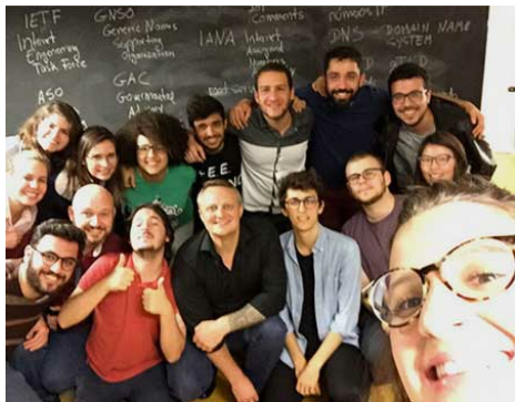
Le centre de participation à distance du Brésil a permis la participation à distance pendant la réunion d'Hyderabad.