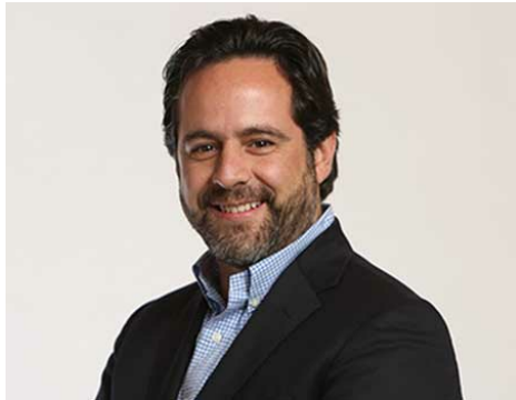
Rodrigo de la Parra, vice-président de l'ICANN pour la région Amérique latine et Caraïbes