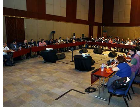
L'espace LAC, tenu lors de la 57e réunion de l'ICANN le 5 novembre 2016, s'est focalisé sur des questions régionales.