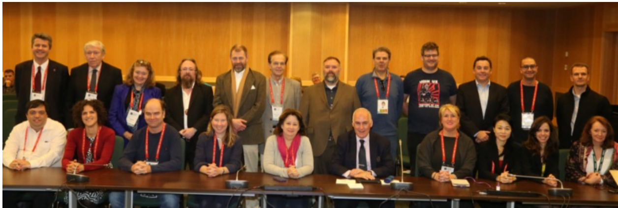
Conseil de la GNSO, 2015-2016