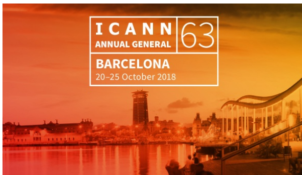
Site web de l'ICANN63

La 63 e réunion de l'ICANN commencera dans seulement cinq jours. Le site web de la réunion est désormais disponible et comprend le programme final, une application mobile et les rapports de préparation à la réunion.