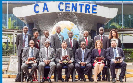
Le personnel de l'ICANN à la 39e réunion de l'Autorité des communications du Kenya