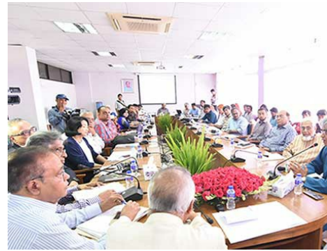
Réunion du NBGP à l'Académie Bangla, au Bangladesh.

Le 10 juillet, le panel de génération en écriture néo-brahmique (NBGP), en collaboration avec l'Académie Bangla (l'organisation linguistique du gouvernement), a tenu une réunion à Dhaka (Bangladesh) avec de nombreuses parties prenantes locales pour discuter de la version préliminaire de la proposition de règles de génération d'étiquettes (LGR) pour la zone racine applicables au script bengali. Cet événement a été le dernier d'une série d'ateliers et de réunions organisés par le NBGP au Bangladesh, en Inde, au Népal et au Sri-Lanka dans le but de finir le travail sur les règles de génération d'étiquettes pour la zone racine pour les écritures bengali, devanagari, gujarati, gurmukhi, kannada, malayalam, oriya, tamoul et télougou.