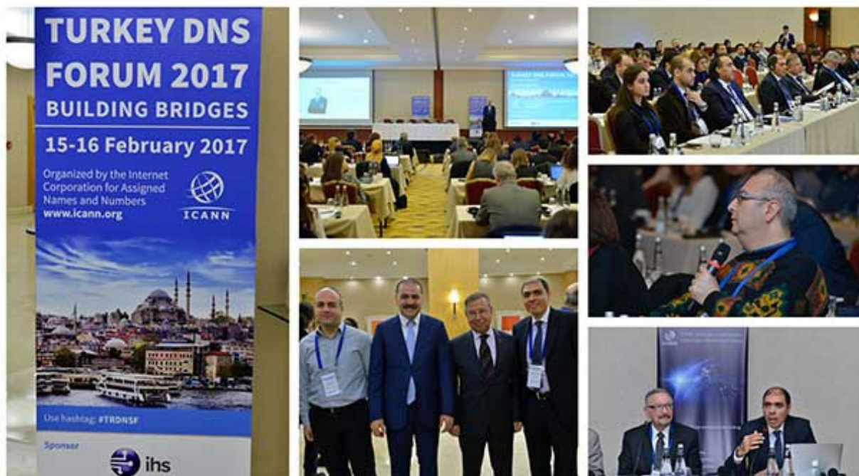
Le Forum sur le DNS turc rassemble des dirigeants de plusieurs secteurs.

Près de 150 participants se sont donné rendez-vous à la troisième édition du Forum sur le système des noms de domaine (DNS) turc , qui a eu lieu du 15 au 16 février 2017 à Istanbul. L'événement a été inauguré par le Dr. Ömer Fatih Sayan, président de l'Autorité des technologies de l'information et de la communication de Turquie (BTK).