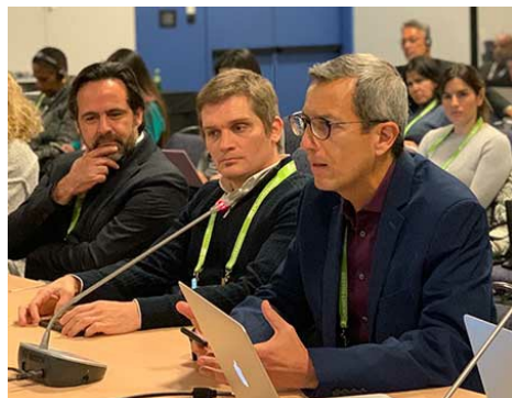
Participantes del Espacio LAC durante la reunión ICANN66 en Montreal