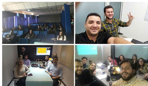
Centros de participación remota en México, Bolivia y Brasil.