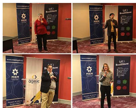
Oradores en el área de difusión durante la edición del LAC-i-Roadshow para América del Sur en Montevideo, Uruguay.