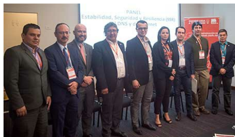
Oradores en la Cuarta Conferencia sobre Tecnología y Seguridad del DNS, 9 de agosto de 2018, Bogotá, Colombia.