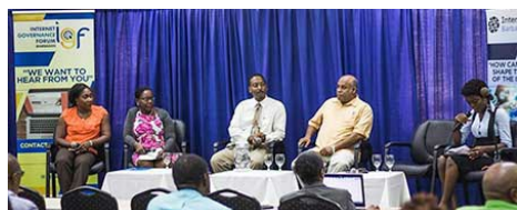
Panel en el segundo IGF celebrado en Barbados.