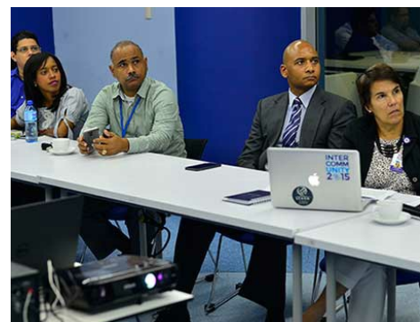
Los participantes aprenden sobre el traspaso de la KSK (Clave para la firma)