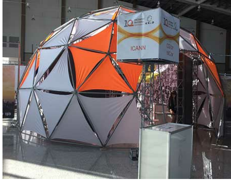
Puesto de información de la ICANN en el evento de la ANID