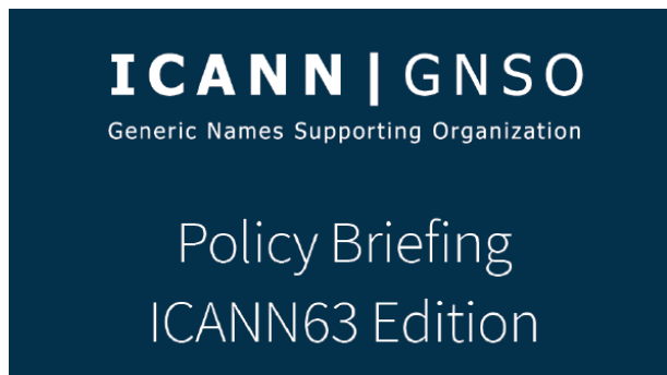
Reunión informativa de la GNSO previa a la reunión ICANN63

¡Los invitamos a participar con nosotros en las sesiones regionales durante la reunión ICANN63!