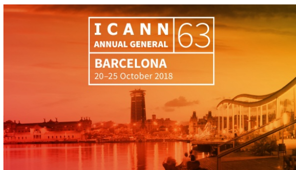
Sitio web de la reunión ICANN63

La reunión ICANN63 comienza en sólo cinco días. El sitio web de la reunión está disponible e incluye el programa final de actividades, la aplicación de reuniones de la ICANN para teléfonos móviles y los informes previos a la reunión.