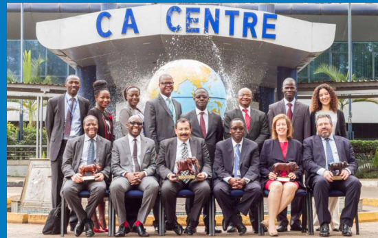
Personal de la ICANN en la Autoridad de Comunicaciones de Kenia