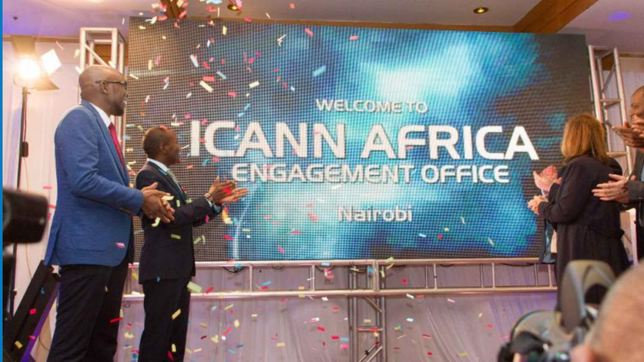
Cena de lanzamiento de la ICANN