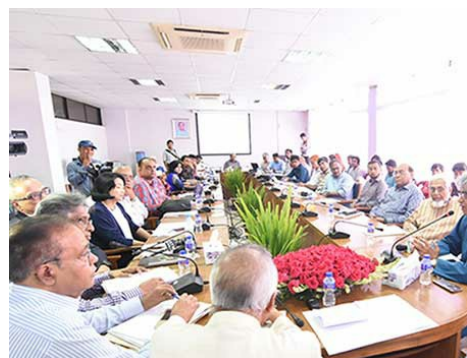
Reunión del NBGP en la Academia Bangla en Dacca, Bangladés.

El 10 de julio, el Panel de Generación en Código de Escritura Bráhmico (NBGP) celebró una reunión muy concurrida en Dacca, Bangladés, en colaboración con la Academia Bangla (la organización lingüística pertinente dirigida por el gobierno) para debatir con las partes interesadas locales la versión preliminar actual de la Propuesta para las LGR para la zona raíz en código de escritura bengalí. Este evento fue el último de una serie de talleres y reuniones organizadas por el NBGP en Bangladés, India, Nepal y Sri Lanka para finalizar el trabajo sobre el Conjunto de Reglas para la Generación de Etiquetas para la Zona Raíz para los códigos de escritura bengalí, devanagari, gujarati, gurmukhi, kannada, malayalam, oriya, tamil y télugu.