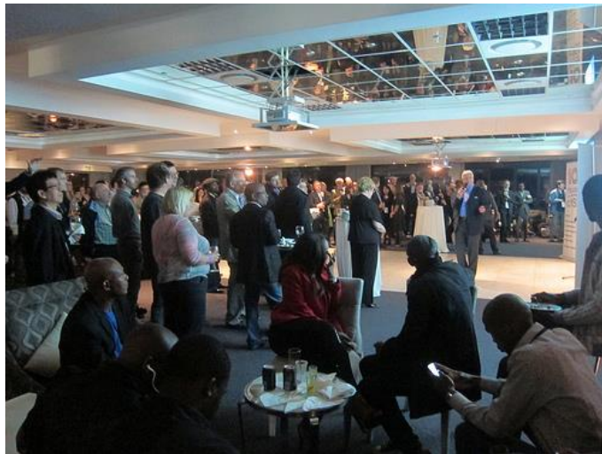
Рис. 1 Коктейльный прием по случаю 10-летнего юбилея ОПНИ

ОПНИ является органом, входящим в структуру ICANN, который был создан управляющими нДВУ и действует в их интересах. С момента своего создания в 2003 году ОПНИ выступала в качестве форума для управляющих национальными доменами верхнего уровня (нДВУ), где они могли встречаться и обсуждать важные проблемы нДВУ на глобальном уровне.