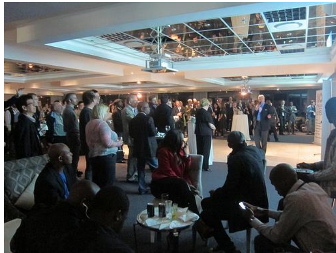
Photo 1 - Cocktail du 10e anniversaire de la ccNSO

La ccNSO est un organe au sein de la structure de l'ICANN créé par et pour les responsables des ccTLD. Depuis sa création en 2003, la ccNSO a mis à disposition des gestionnaires des noms de domaine de premier niveau de codes de pays (ccTLD) un forum pour se rencontrer et discuter des problématiques qui préoccupent les ccTLD au niveau mondial.