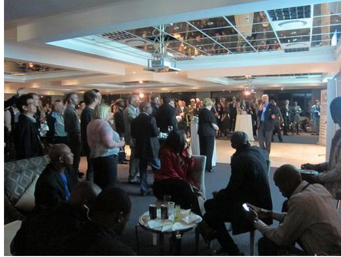
صورة 1 - احتفالية استقبال بالذكرى السنوية العاشرة لـ ccNSO