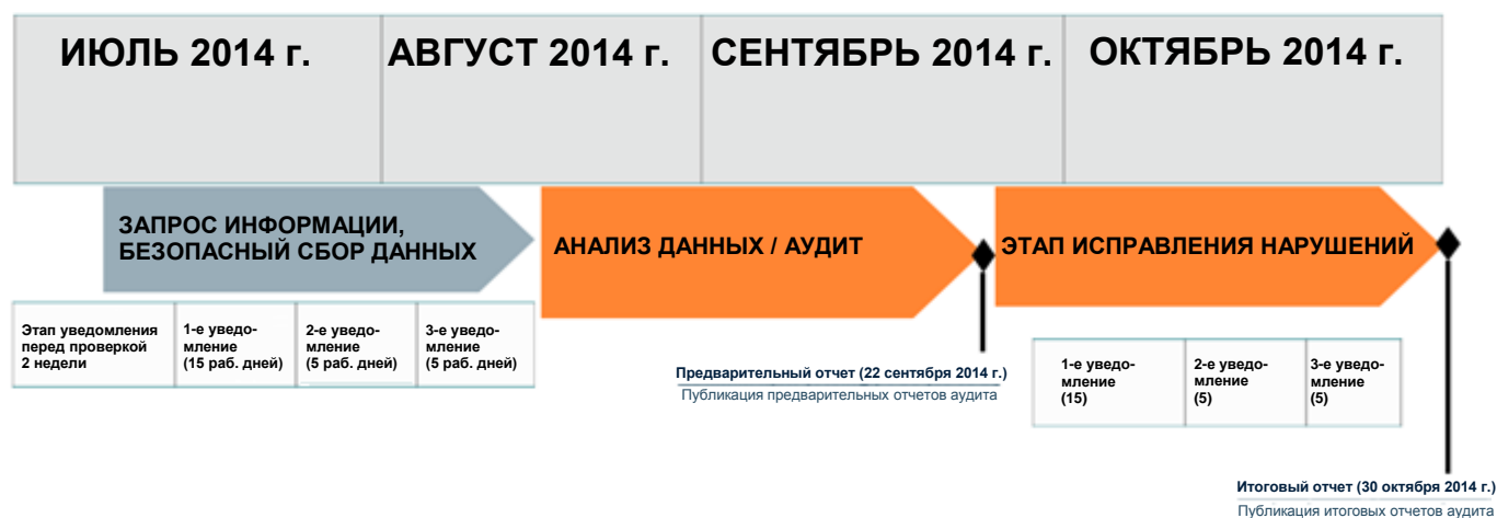
График аудита нового Соглашения о регистрации

Если у вас возникают вопросы, обращайтесь по адресу эл. почты ComplianceAudit@icann.org .