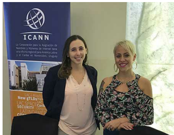
Estande da ICANN no LACNIC29

O LACNIC 29 foi realizado de 30 de abril a 4 de maio na Cidade do Panamá, no Panamá. O evento foi um sucesso e contou com a participação de 800 pessoas do mundo todo. A ICANN instalou um estande onde a equipe regional compartilhou material relevante sobre nossas atividades globais e regionais. No estande, informamos aos participantes sobre nosso próximo Fórum de Políticas que será realizado na Cidade do Panamá, de 25 a 28 de junho, no mesmo local.