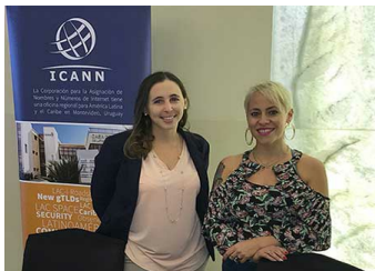
Puesto de información de la ICANN en LACNIC29

LACNIC 29 se celebró del 30 de abril al 4 de mayo en Ciudad de Panamá, Panamá. El exitoso evento recibió a 800 participantes de todo el mundo. La ICANN tuvo un puesto de información, donde nuestro personal de la región compartió material relevante sobre las actividades globales y regionales de la organización. En el puesto, informamos a los participantes sobre nuestro próximo Foro de Políticas que se celebrará en Ciudad de Panamá del 25 al 28 de junio en la misma sede.