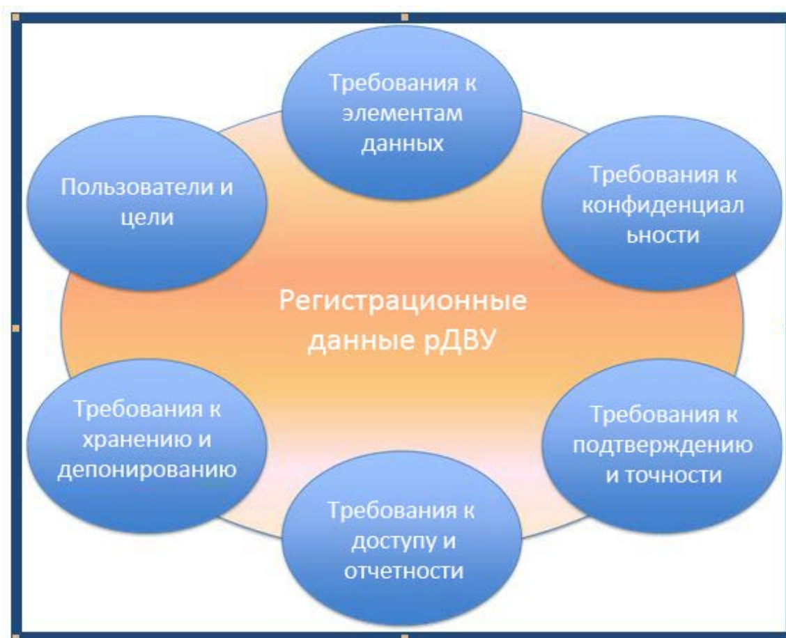
Рис 1. Анализ потребностей

Кроме того, ЭРГ приняла во внимание справочные материалы с результатами предыдущей деятельности, связанной с WHOIS, вклад сообщества и примеры использования для изучения конкретных потребностей в каждой из областей, указанных ниже на Рис. 1.