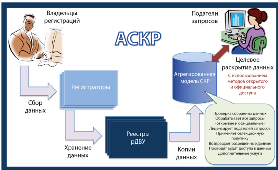
Рис. 4. Агрегированная модель СКР