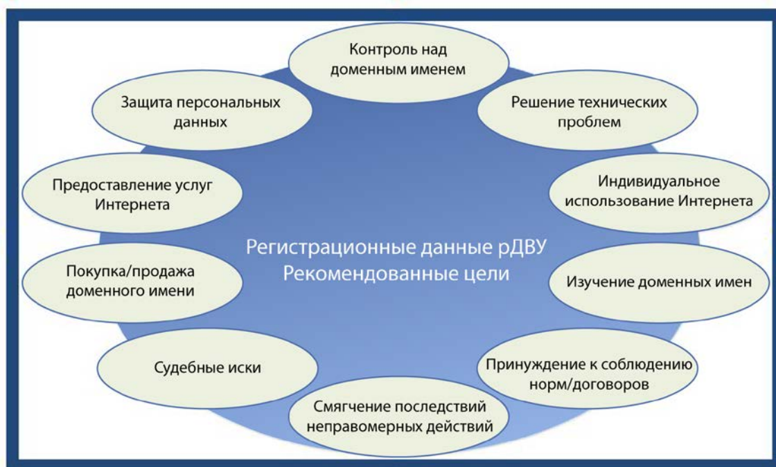
Рис 3. Цели

ЭРГ стремилась определить приоритет целей, перечисленных в разделе 3.2, чтобы сосредоточить внимание на проработке вариантов использования и сузить спектр разрешенных целей. Однако возникли трудности при попытках обосновать необходимость предоставить новую систему только некоторым из пользователей, имеющих доступ к нынешней системе WHOIS, но отказать другим, при условии, что их цели не являются злонамеренными. Этот вывод привел к тому, что ЭРГ рекомендует некоторым образом учесть в рамках СКР все цели, указанные в разделе 3.2, за исключением известной злонамеренной деятельности в Интернете, которой следует активно препятствовать. Таким образом, рекомендованные ЭРГ разрешенные цели обобщены ниже.