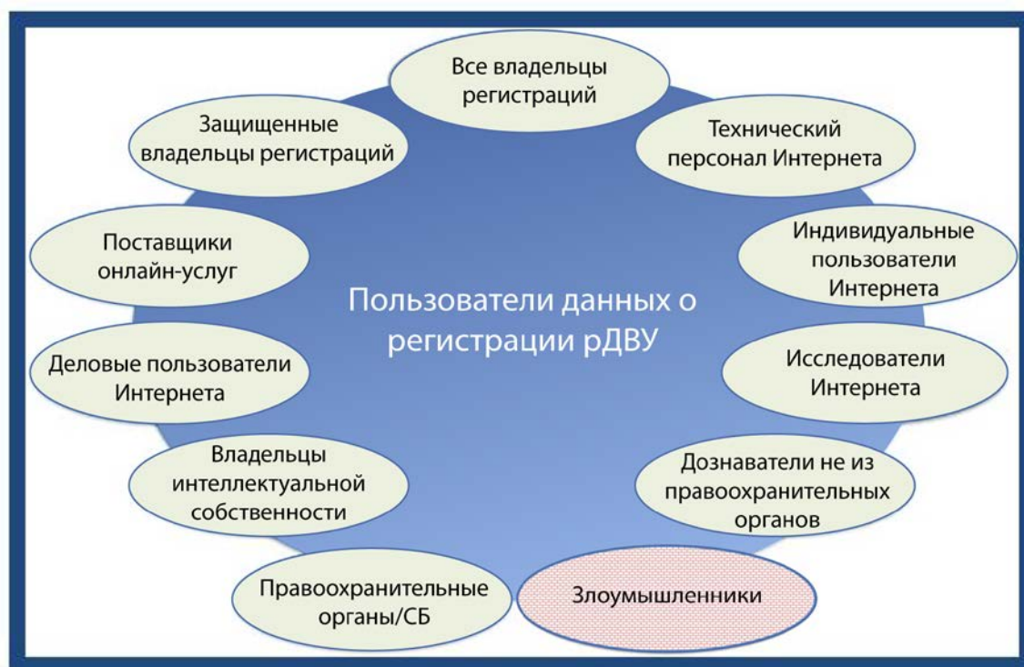
Рис 2. Пользователи

На рис. 2 изложена неполная сводная информация о пользователях существующей системы WHOIS, включая как тех, кто использует ее в конструктивных целях, так и тех, кто использует ее в злонамеренных целях. В соответствии с кругом обязанностей ЭРГ, все эти пользователи были изучены для определения существующих и возможных будущих рабочих процессов и участвующих в них заинтересованных сторон.