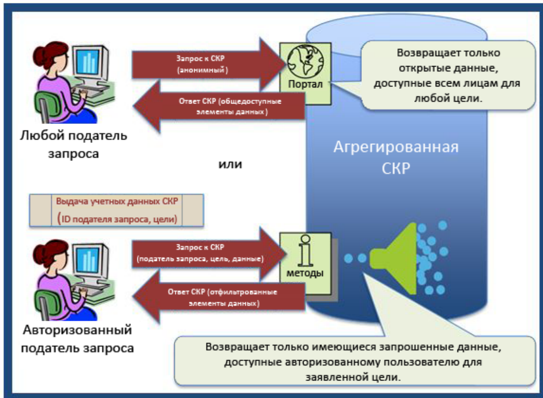
Рис. 5. Модель авторизованного доступа

ЭРГ планирует продолжить обсуждение методов мультимодального доступа и способов их реализации с помощью существующих или возможных в будущем протоколов доступа к регистрационным данным.