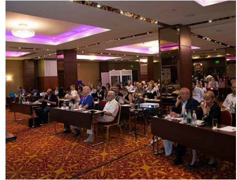
Geçtiğimiz yıl TLDCON Eylül 2015'te, Erivan, Ermenistan'da düzenlendi.

Konferansa katılım ücretsizdir. Ön programa göz atın ve TLDCON'a kaydolun!