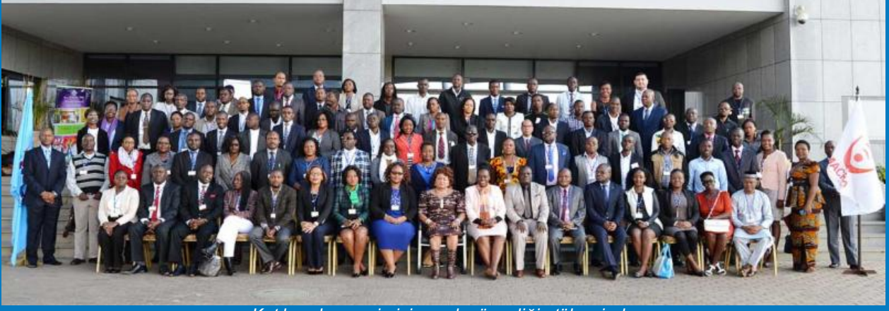
Katılımcılar çevrimiçi çocuk güvenliği atölyesinde

18-21 Temmuz 2016 tarihleri arasında Lilongwe, Malavi'de düzenlenen Afrika ülkelerinde çevrimiçi çocuk güvenliğine ilişkin ITU yıllık kapasite geliştirme atölyesine 100'ün üzerinde temsilci katıldı. "Dijital dünyada çevrimiçi çocuk güvenliğini (COS) sağlama: COS politika oluşturulması ve uygulanmasına ilişkin insan kapasitesini geliştirme" isimli atölye; Afrika ülkelerinin deneyimlerini paylaşması, bilgisini artırması ve çocuklar ve gençler için güvenli dijital katılım farkındalığının artırılması için bir platform sağladı. Atölye; çocuklar ve gençlerle ilgilenen eğitimcileri, ICT'yi, telekomünikasyon düzenleyicilerini ve bakanlıkları, endüstri sivil topluluğu, sivil toplum örgütleri ve diğer örgütleri kapsayan çok paydaşlı bir yaklaşım kullandı.