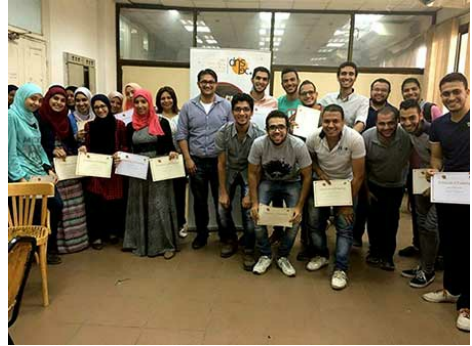
DNS operasyonları ve DNSSEC üzerine eğitimini tamamlayan öğrenciler sertifikalarını gösteriyor. Eğitim 17-21 Temmuz 2016 tarihlerinde Kahire'deki Ain Shams Üniversitesi'nde gerçekleşti.