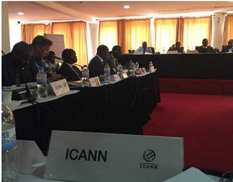
Katılımcılar Akıllı Afrika İttifakı'nda görüşmede

Daha fazla bilgi edinin ve atölye sunumlarına göz atın.