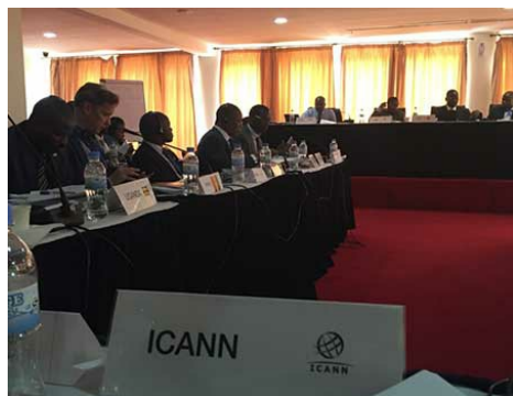
Участники дискуссии на мероприятии Smart Africa Alliance.

Узнать больше и прочитать доклады семинара .