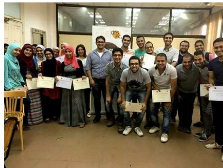
Участники, закончившие тренинг по эксплуатации и функционированию DNS и DNSSEC с гордостью демонстрируют грамоты об окончании тренинга. Тренинг прошел в Каире в Университете Айн Шамс 17-21 июля 2016 года.