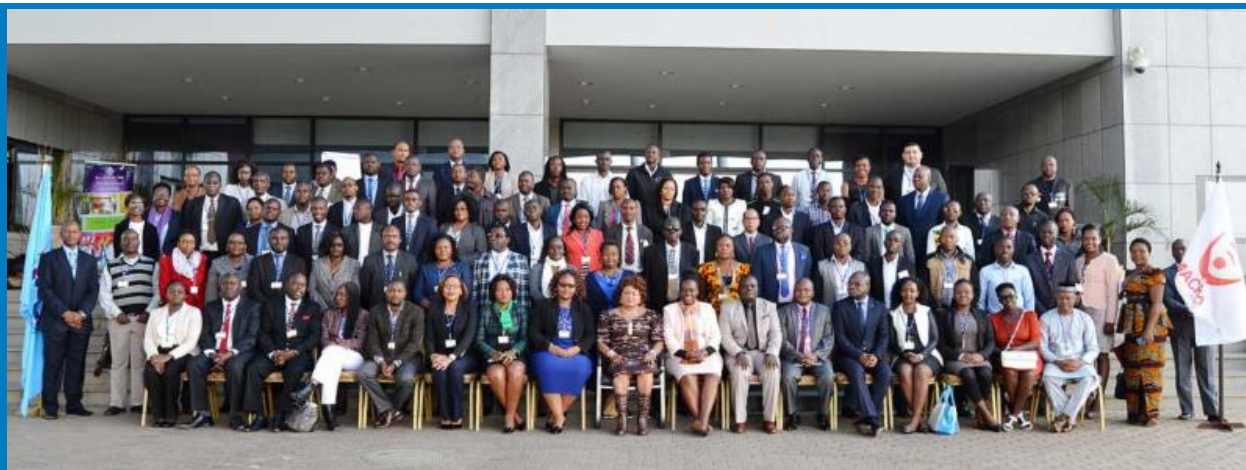
Участники семинара по безопасности детей в сети

Более 100 делегатов участвовали в прошедшем в Лилонгве, в Малави 18-21 июля 2016 года ежегодном семинаре МСЭ по расширению возможностей обеспечения безопасности детей в сети для Африканских стран. Семинар под названием «Обеспечение безопасности детей в сети в цифровом мире: наращивание человеческих возможностей в отношении формирования политики в области безопасности детей в сети» представило платформу, на которой африканские страны смогут делиться опытом, расширять знания и повышать осведомленность о безопасном включении в цифровую жизнь для детей и молодежи. Семинар использовал философию подхода с участием многих заинтересованных сторон, что выражалось в привлечении учителей, регуляторов и министерств по ИКТ и телекоммуникациям, представителей отрасли, гражданского общества, неправительственных и других организаций, занимающихся детьми и молодежью.