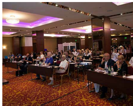
В прошлом году TLDCON прошел в Ереване, в Армении в сентябре 2015 года.

Конференция бесплатная. Изучите предварительную программу и зарегистрируйтесь на TLDCON!