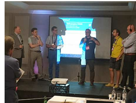
Sunucular, ENOG12'de toplanan katılımcılarla ilgi çeken konuları tartışıyor.