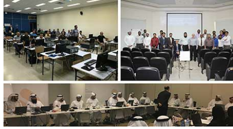
Beyrut, Doha ve Dubai'de, DNSSEC'ye ilişkin olarak yakın zamanda gerçekleştirilen atölyeler, ICANN'in Orta Doğu stratejisinin bir parçası niteliğindedir.