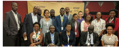
2016 Afrika İnternet Yönetişimi Forumu Katılımcıları

Afrika İnternet Yönetişimi Forumu ( AfIGF2016 ), bu yıl 16-18 Ekim tarihleri arasında Güney Afrika'nın Durban Şehrinde gerçekleştirildi. Etkinliğe İletişim ve Posta Hizmetleri Bakanlığı ile Güney Afrika Devletinin yanı sıra, Afrika Birlik Komisyonu ile Birleşmiş Milletler Afrika Ekonomik Komisyonu (ECA) birlikte ev sahipliği yaptı. Etkinliğe 235 kişi katıldı; ayrıca 800 kişi de çevrimiçi ortamda katılım gösterdi.