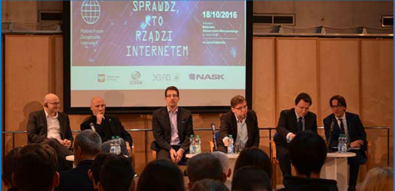
ICANN Avrupa Küresel Paydaş İlişkileri Başkan Yardımcısı Jean-Jacques Sahel (solda), Polonya IGF'nin açılış törenindeki bir panele katılıyor.

2014 yılında gerçekleştirilen "Bugünün ve Yarının İnterneti Konferansı" başlıklı tek günlük bir etkinlik, başarılı bir şekilde bu yıl 18 Ocak 2016 tarihinde Varşova'da gerçekleştirilen ilk Polonya IGF'si haline geldi. Bu etkinlik; ICANN, Polonya İdare ve Sayısallaştırma Bakanlığı, Varşova Dijital Ekonomi Laboratuvarı Üniversitesi (DELab) ve .pl ülke kodu üst düzey alan adının (ccTLD) yöneticisi olan Araştırma ve Akademi Bilgisayar Ağı'nın (NASK) ortak çabalarıyla gerçekleştirildi. Hep birlikte, bu organizasyonlar İnternet yönetişimine ilişkin uygun bir yerel diyalog platformu yarattı.