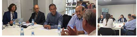
Katılımcılar, yeni gTLD'lere ilişkin tartışmalar için Barcelona'da gerçekleştirilen medya yuvarlak masasında toplanıyor.