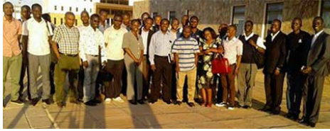
Delegeler, Ağustos'ta Dodoma, Tanzanya'da gerçekleşen İnternet Yönetimi Atölyesi'nde toplandı.