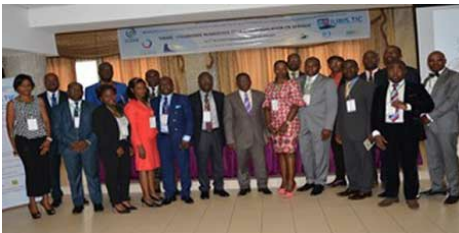
Katılımcılar, Yaounde, Kamerun'daki Dijital Ekonomi ve Siber Kanunlar atölyesinde bir araya geldi.

MEAC-SIG hakkında daha fazla bilgiye buradan ulaşabilirsiniz.