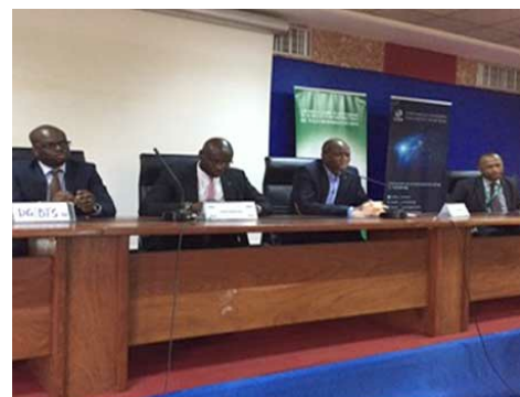
Участники дискуссии, в том числе Пьер Данджину (Pierre Dandjinou) (второй справа) из ICANN, обсуждают цель правительства Бенина - ускорение развития и сокращение безработицы за счет инвестиций в цифровую экономику.

Во время презентаций был выполнен сравнительный анализ данных различных стран из региона Западной Африки. В конце участники обратились к регистратуре ccTLD с призывом внедрить расширения безопасности системы доменных имен (DNSSEC) и улучшить свою систему управления регистрацией доменных имен (как процедуру, так и стоимость).