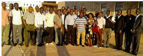
Делегаты, приехавшие в августе на семинар по вопросам управления интернетом в Университет Додоми (Танзания).

Структура At-Large CAPDA проводит это мероприятие в Яунде с 2011 года. Спонсирующими мероприятием партнерами выступили ICANN, южноафриканское подразделение Huawei, Microsoft и MTN Group.