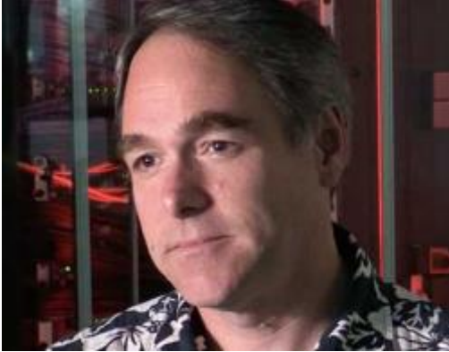
انقر هنا لمشاهدة المقابلة مع ديفيد

تعرض ICANN منصة اختبار لمشغلي الشبكات والأطراف المعنية الأخرى للتأكد من قدرة أنظمتهم على القيام بعملية التحديث التلقائية لتغيير مفتاح الدخول الرئيسي (KSK) الجديد والخاص بالإمتدادات الأمنية لنظام أسماء النطاقات (DNSSEC) في منطقة الجذر. ومن المقرر أن تتم عملية تغيير مفتاح الدخول الرئيسي في 11 تشرين الأول (أكتوبر) 2017.