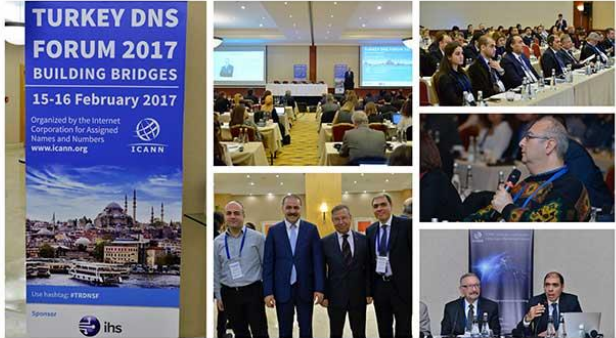
يجمع منتدى تركيا لنظام اسم النطاق قادة من مختلف القطاعات.

حضر حوالي 150 مشارك إلى منتدى تركيا لنظام إسم النطاق (DNS) الثالث والذي أقيم للفترة من 15-16 شباط (فبراير) 2017 في إسطنبول. وقد أفتتح المنتدى من قبل الدكتور عمر فاتح سايان، رئيس هيئة المعلومات والاتصالات (BTK) في تركيا.