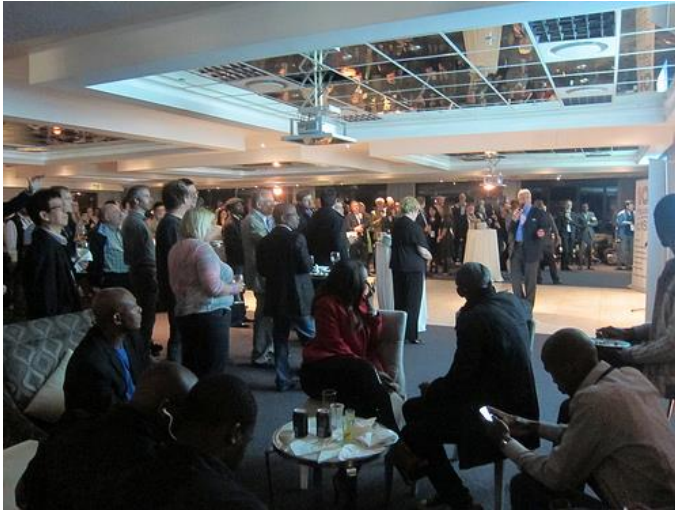
Foto 1 - Cóctel de Recepción del 10mo Aniversario de la ccNSO

La ccNSO ha celebrado su 10 mo aniversario en un cóctel especial de recepción con la Junta Directiva de la ICANN, en Durban. La recepción incluyó una presentación destacando la historia de la ccNSO y sus logros, incluyendo el Programa de Avance Acelerado de Dominios de Alto Nivel con Código de País de Nombres de Dominio Internacionalizados (IDN ccTLDs) y su crecimiento a cerca de 140 miembros.